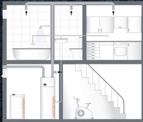
BEISPIEL C (Type Europa 323 DK)