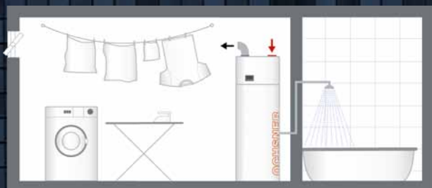
BEISPIEL B (Type Europa Mini IWP, 303 DKL und 323 DK)